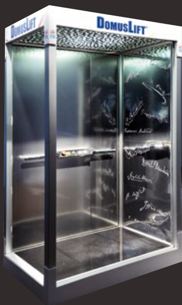
1° Classificato / 1 st LE FIRME DEL NOVECENTO (The Signatures of the 20 th Century) Elena Fuggetta | Elisa Vistosi

L'ascensore è un punto di passaggio, spesso pieno di silenzi, mezzo di trasferimento da un piano a un altro, da un ambiente all'altro. Pannelli di rivestimento in metallo satinato a riprodurre le firme dei più importanti artisti del Novecento, a testimonianza del genio di queste persone. Un segno che rimane inciso, capace di fermare il tempo, uno strumento per segnare il loro passaggio, un passaggio che ha segnato la storia.