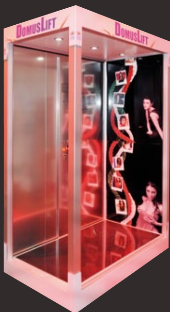
3° Classificato / 3 rd SIAMO DONNE... OLTRE ALLE GAMBE C'È DI PIÙ (We are women... not just legs) Debora Tolotta | Samanta Berti

White birds bringing a message of peace and hope, because our world is sadly affected by wars, disasters and destructions. To enjoy and remember every single moment of happiness and make it unforgettable. The resin lift floor shows the birds' footprints, on the lift wall panel plastic birds seem to be about to break the wall and fly.