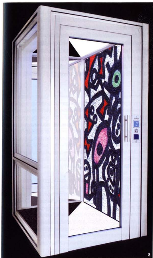
8. L'albero, la casa, le farfalle nel cielo , ascensore domestico caratterizzato dalla cabina con pannello decorato di home lift fitted with a cabin with a panel decorated by Abet Laminati (IGV Domus Lift).