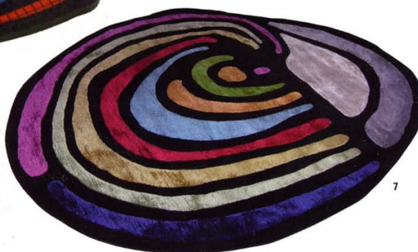
7. L'arcobaleno , tappeto annodato a mano in seta e lana a fasce colorate/hand-knotted rug made of coloured strips of silk and wool, 150x180 cm (SoFarSoNear).