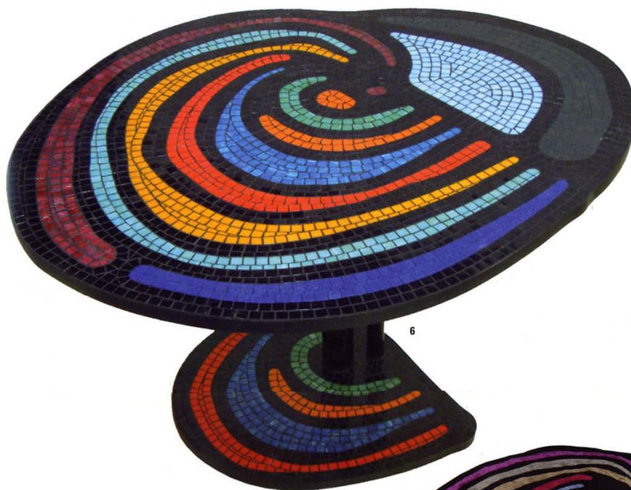
6. L'arcobaleno , tavolo con piano e base in mosaico realizzato con tessere di vetro riciclato post consumo, struttura verniciata near/table with a mosaic top and base made of bits of used recycled glass, painted structure, ø100xh 75 cm (Trend con B&B Biagetti).