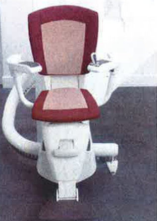
SU E GIÙ PER LE SCALE Il montascale di Motolift, configurabile dal sito web per capire quali sono i costi; a sinistra, il modello Flow di Thyssengroup.