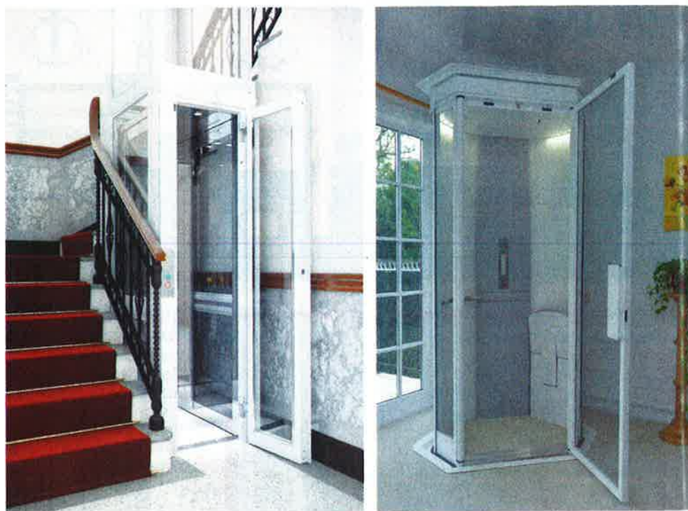
I MINIASCENSORI Sopra, da sinistra, il miniascensore Domuslift di IGV Group si adatta a ogni spazio. Su richiesta, anche con porte scorrevoli. Salise, il modello di Stannah, scompare dal piano inferiore quando monta al superiore.

→ comandando a distanza finestre, tende e tapparelle ( www.velux.it ). RIPULIRE L'ARIA. L'inquinamento è anche dentro casa: per questo è importante utilizzare prodotti strategici. Saint Gobain, per esempio, propone la gamma Activ'Air®, con intonaci in grado di abbattere l'80% della formaldeide presente negli