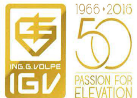
IGV 50 th anniversary logo

Hayez, Michelangelo and Botticelli are artists we can now enjoy in the small space of a lift car and this is the concept of IGV Group DomusLift limited edition: enjoying art, genius and harmony at home.