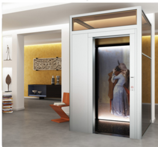
Der neue DomusLift Art – Limited Edition