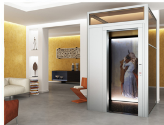
The new DomusLift Art – Limited Edition statues are only displayed in museums?

The party was the occasion for unveiling the first DomusLift Art – Limited Edition, a new version of the lifting platform enriched with Italian art masterpieces. Beauty helps to live a better life, so why not enjoying a work of art at home, while usually paintings and