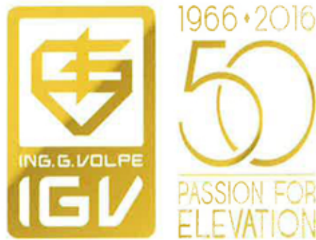
IGV-Logo zum 50. Geburtstag

Am 25. Juni dieses Jahres feierte die IGV Group den 50. Geburtstag mit einer großen Feier in der Zentrale in Vignate, Mailand – Italien. Mehr als 600 Gäste, darunter Betreiber, Vertreter der Behörden und Angestellte nahmen teil und genossen Events wie eine Kochshow, Livemusik und akrobatische Tänze.